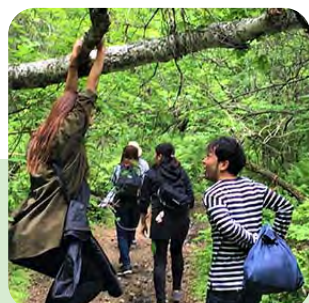
仲間とキャンプの下見へ