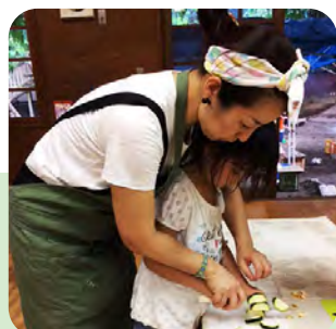
子どものやりたい！を大切に